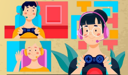
Análisis de la obra