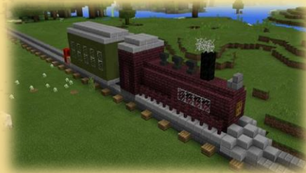
El ferrocarril minecraft